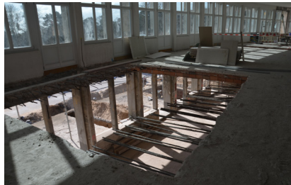
Sanierung der bauzeitl. Ziegeldecke 04.2019