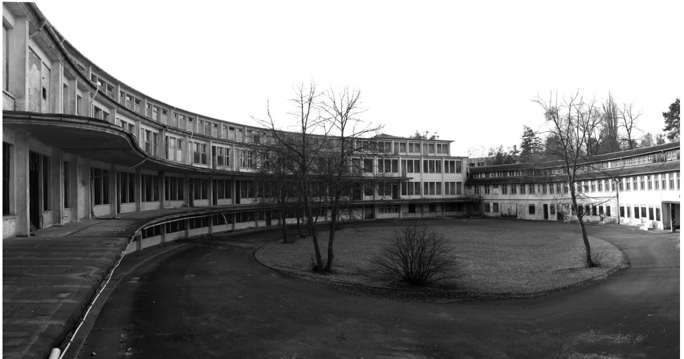
Speisehaus der Nationen - Bestand 2017