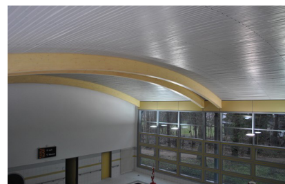
Bewegungsbad Decke