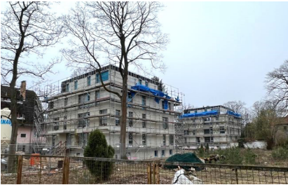
Baustelle nach Rohbau