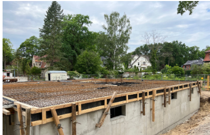
Baustelle im Rohbau