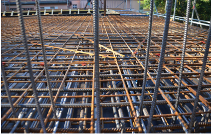
Bauzustand Juli 2018