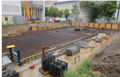
Baufortschritt Sohlplatte Herbst 2016