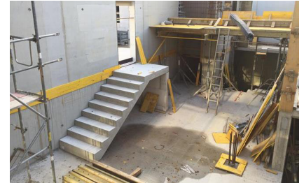
Baufortschritt Herbst 2016